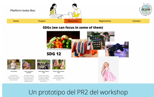
Un prototipo del PR2 del workshop