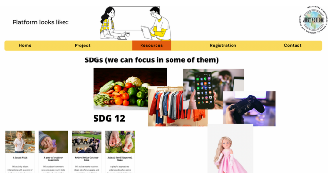
El prototipo de PR2 del taller de Design Thinking

En general, fue un taller muy interesante y emocionante. Nos unimos más como equipo, y los retos planteados por Claire supusieron beneficios para el proyecto en el mundo real. ¡Estamos deseando ver cómo se traduce esto en los resultados de nuestro proyecto!